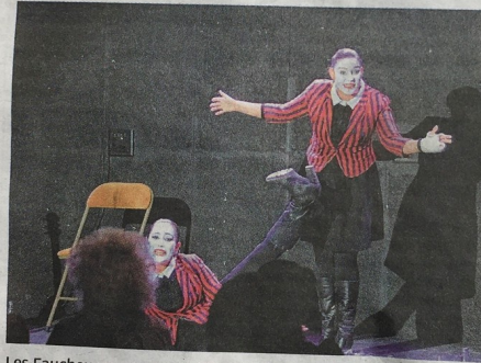
Les Faucheuses ont captivé l'auditoire pendant plus d'une heure, ce mercredi soir.