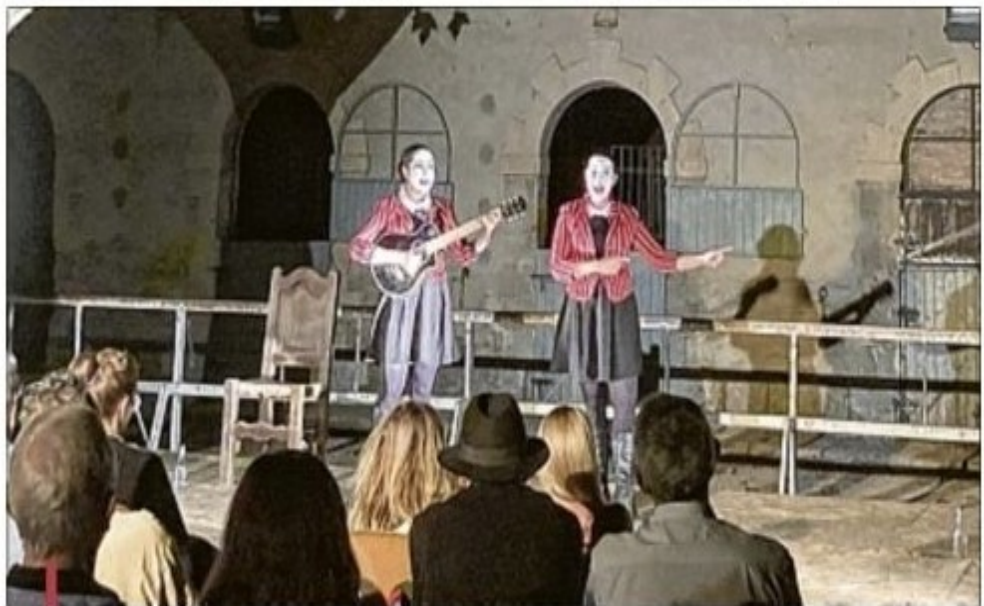
Le duo de chansonnières "Les Faucheuses", qui a joué pour la première fois dans la région, propose des stages d'initiation visant à mélanger les générations et à créer du lien.

Elles souhaitent que les habitants d'une même commune se rencontrent autrement ; que les générations se mêlent afin de créer un spectacle en cinq jours. Et Les Faucheuses de compléter : "Une représentation publique à l'issue du stage est essentielle. Beaucoup de personnes n'osent pas ou ne se sentent pas légitimes de participer à un stage de théâtre, par pu-